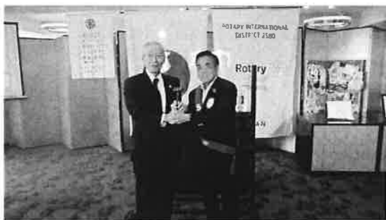
原会長から茶木会長へ